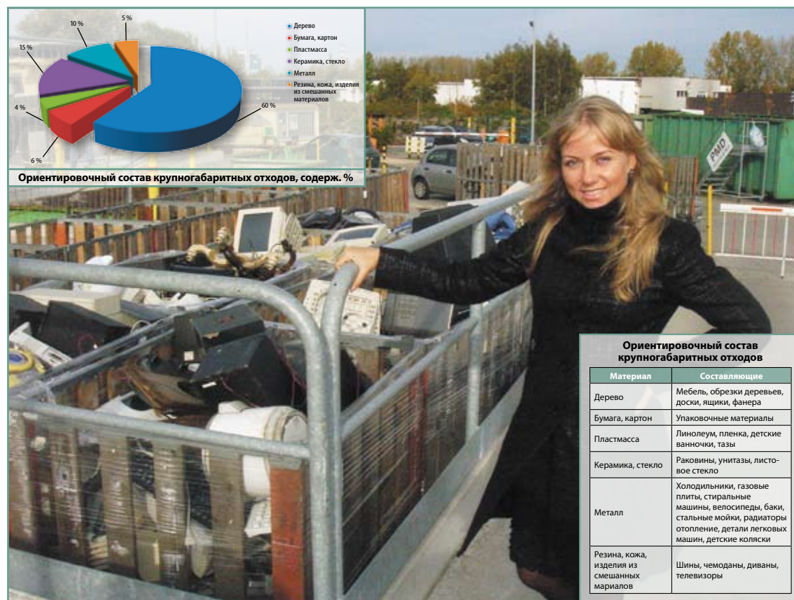
Рис. 2. Ориентировочный состав крупногабаритных отходов

Нормы накопления отходов, до принятия Конституции РФ, в которой по-новому закреплена структура органов власти и разграничение их полномочий, утверждались исполкомами городских (районных) Советов народных депутатов [12, п. 6.2; 13,